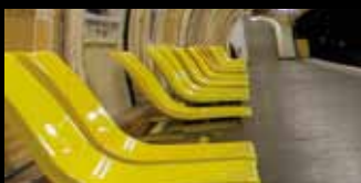
QUAI DU MÉTRO ODÉON Paris