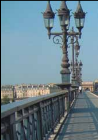
PONT DE PIERRE Bordeaux