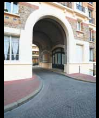
RUE D'ANNAM Paris 20 e

SMAC a construit sa légitimité au fil des 125 dernières années. Une expérience précieuse acquise sur l'ensemble du territoire national couvert par un réseau d'agences particulièrement dense. Cette organisation permet à SMAC de faire preuve de réactivité et ce, quelle que soit la taille et la nature des chantiers qui lui sont confiés. Maîtrisant l'ensemble de la chaîne, de la fabrication d'asphalte coulé à l'application en passant par les travaux préparatoires, SMAC vous conseille et s'adapte à vos demandes.