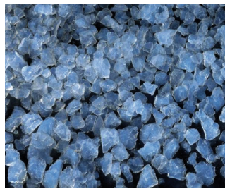
Isolant Lumira™ aerogel